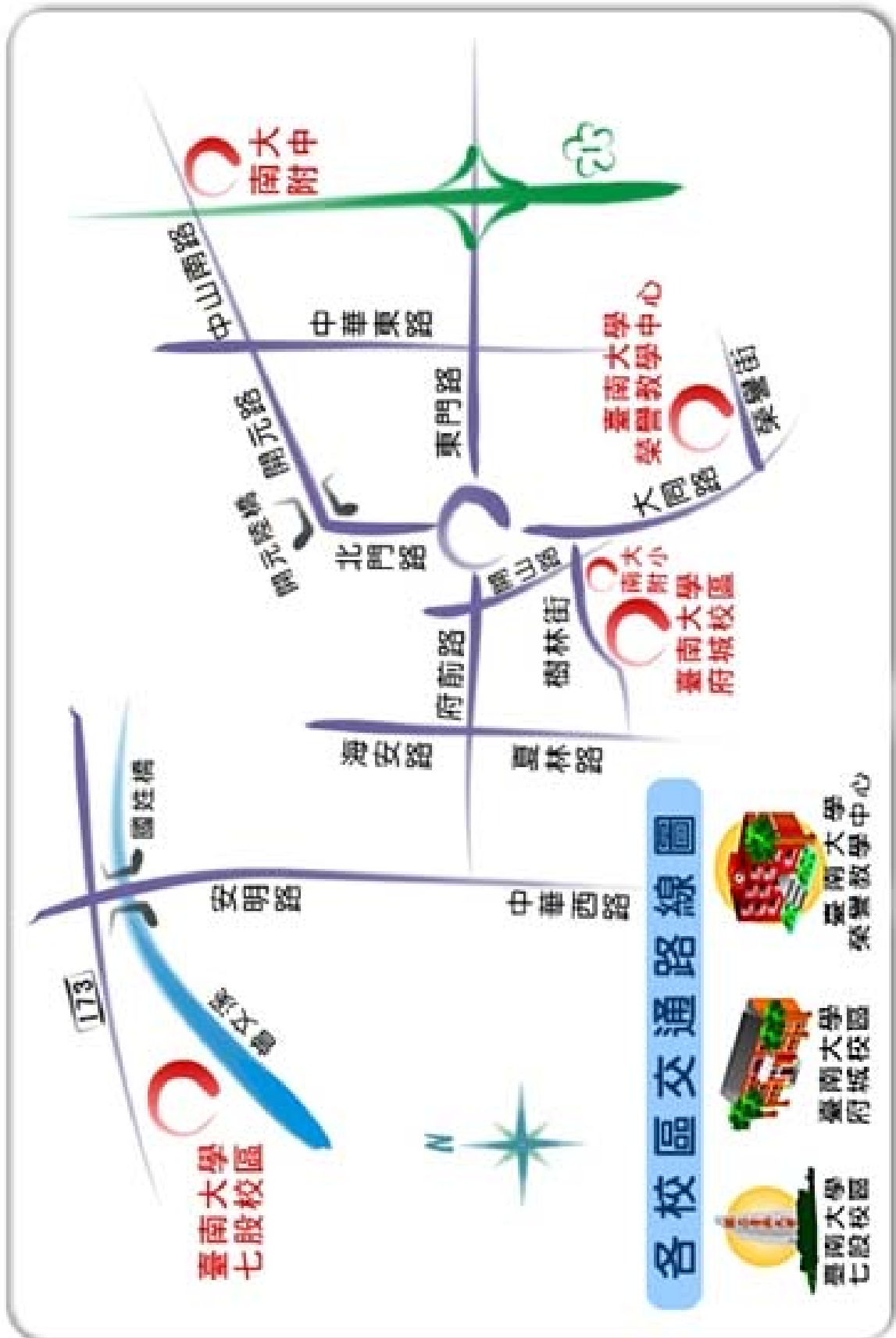
附件一 國立臺南大學府城校區路線圖