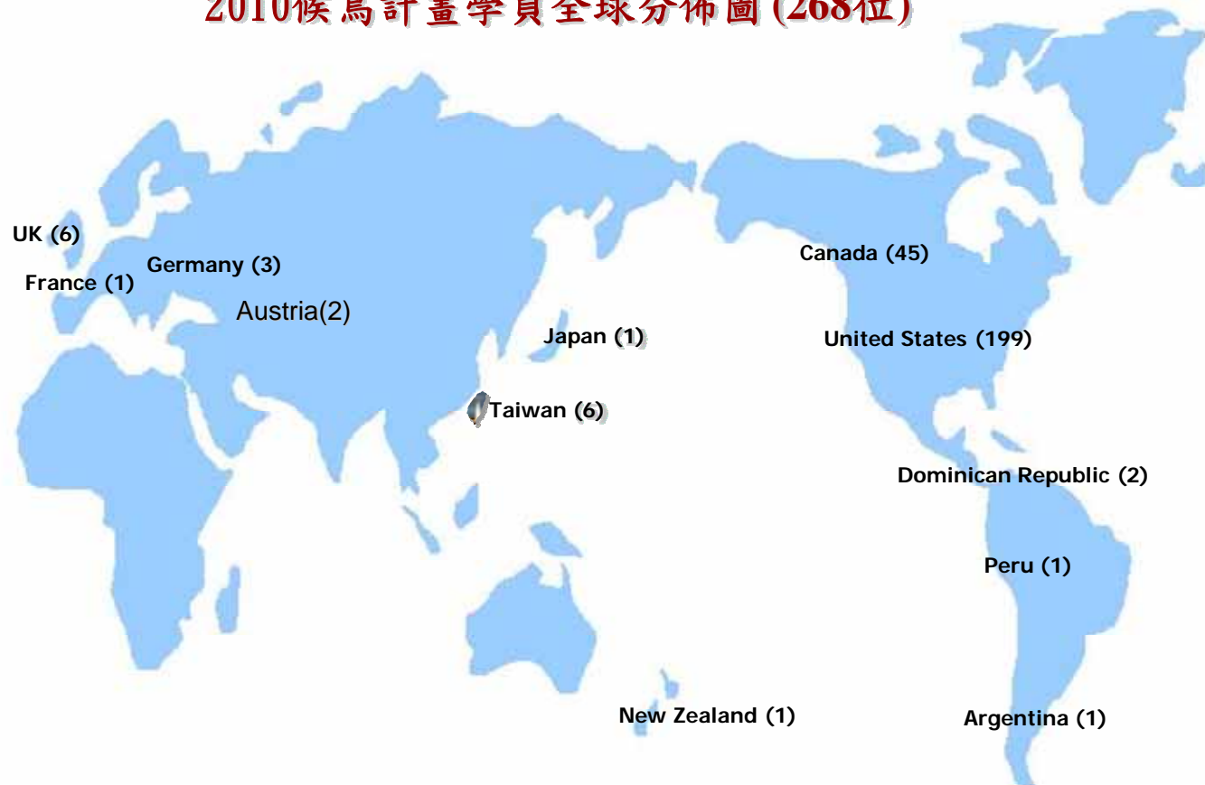
2010候鳥計畫學員全球分佈圖 (268位)