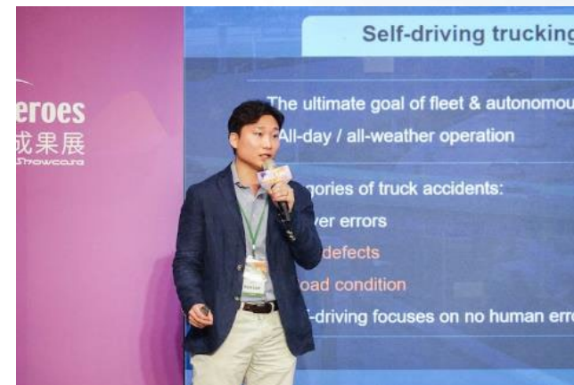
績優團隊上台pitch時間