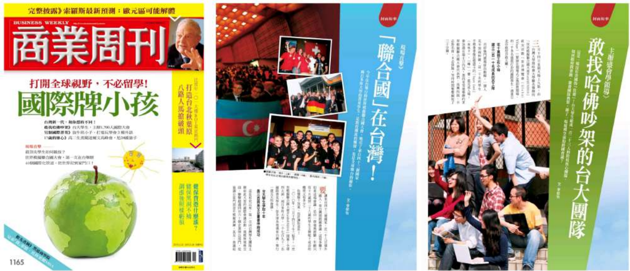
▲ 商業周刊在 2010 年會議主辦後對臺大主辦團隊的專題報導

2010 年台灣獲頒主辦權時，造成了廣大的媒體迴響與關注，「全台大學生都知道有這場會議」。