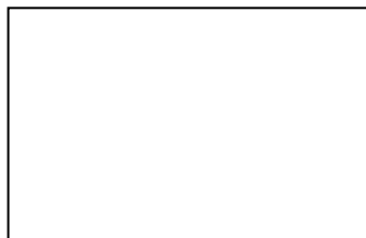
圖 1 XX