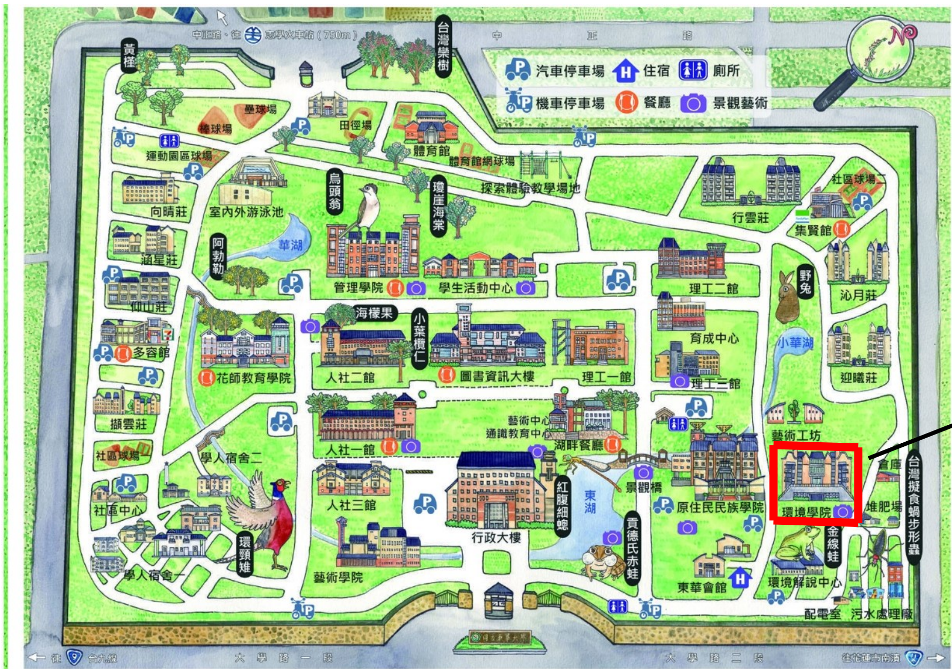
上課地點：環境學院校園位置示意圖