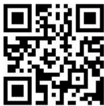
報名網址 QR Code